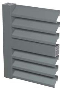
LAMAS FORMA DE Z