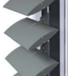
BS 100 FIJACIÓN LAMA