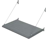
BS 100 MARCOS PRE-ENSAMBLADOS