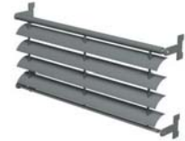
BS 20 MARCOS PRE-ENSAMBLADOS