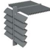
BS 100 LAMA FIJA